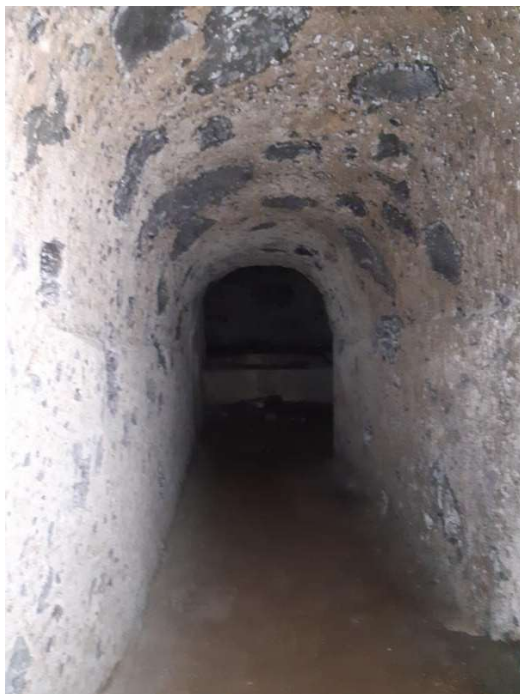
Fotografia n. 218 Cantina. Vista dell'interno.